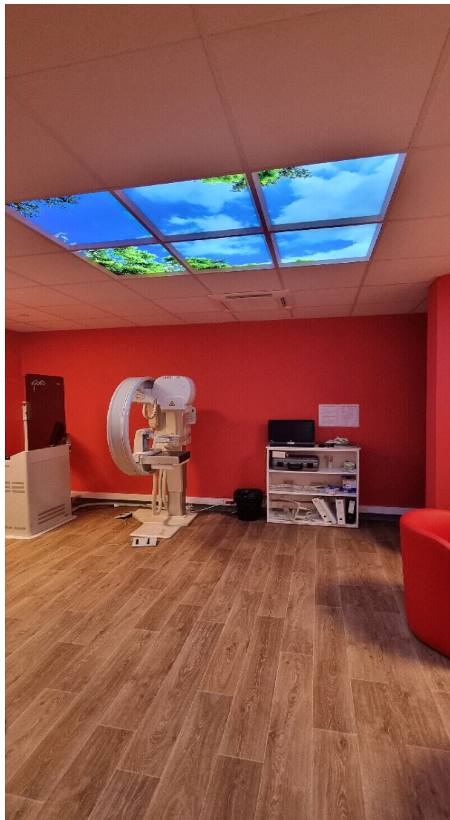
Salle de mammographie, Hôpital Maillot, BRIEY.